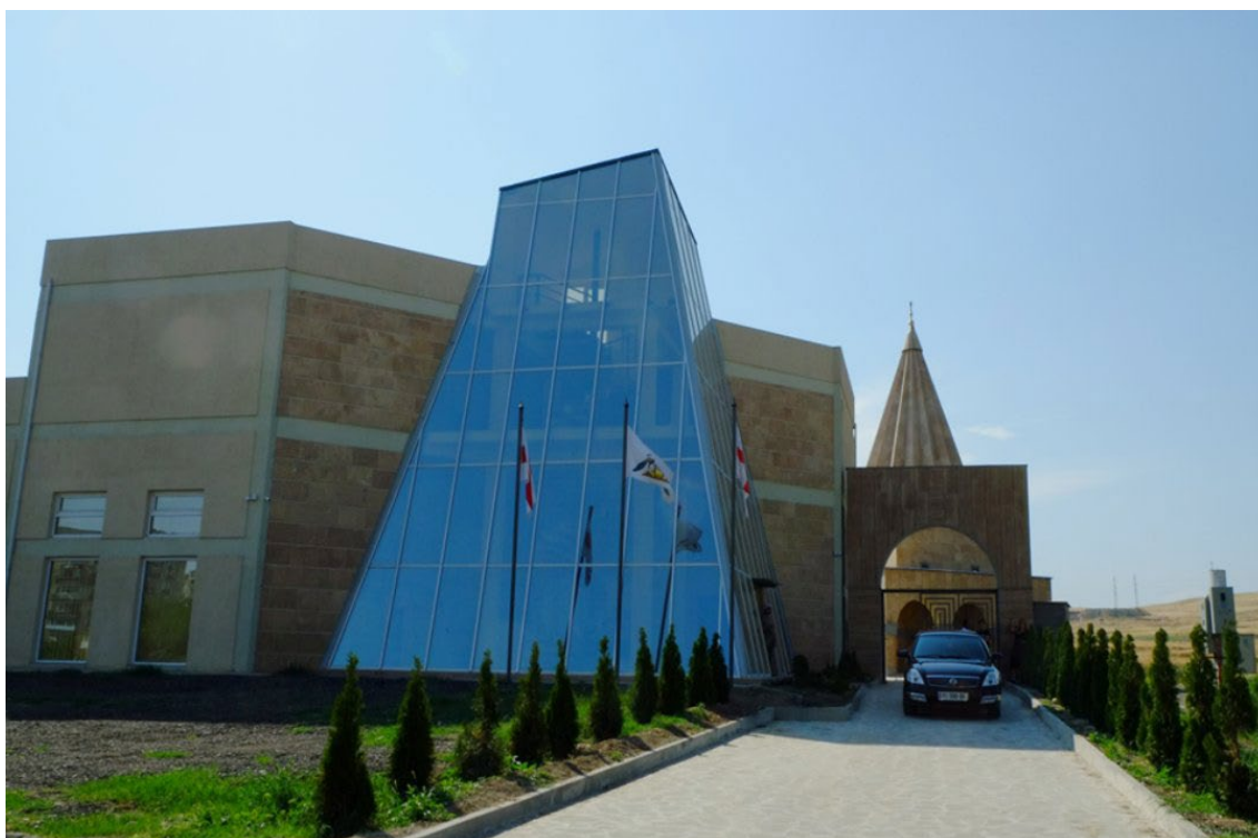
Budynek jezydzkiego centrum kultury i sanktuarium.

Odpowiedzi na część z tych pytań znalazły się także w prezentowanym niżej zapisie rozmów z Dmitrijem Pirbarim, które przeprowadziłem 28 i 29 stycznia 2016 roku oraz 1 i 3 marca 2017 roku w Tbilisi.