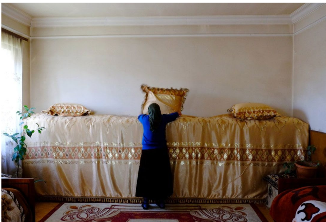
Układanie steru , Armenia.

Ster jest w każdej jezydzkiej rodzinie. Przygotowaniem steru zajmują się kobiety. Słowo to oznacza gwiazdę. Gwiazdę, światło dla całej rodziny. Uważa się, że znajduje się tam miejsce Opiekuna Rodziny, Khodane Male , świętego. To święty, wcielony anioł. Każdy ród i plemię ma własnego świętego. Dobrze, jeśli ster znajduje się w osobnym pokoju, gdzie nie śpi małżeństwo czy para.