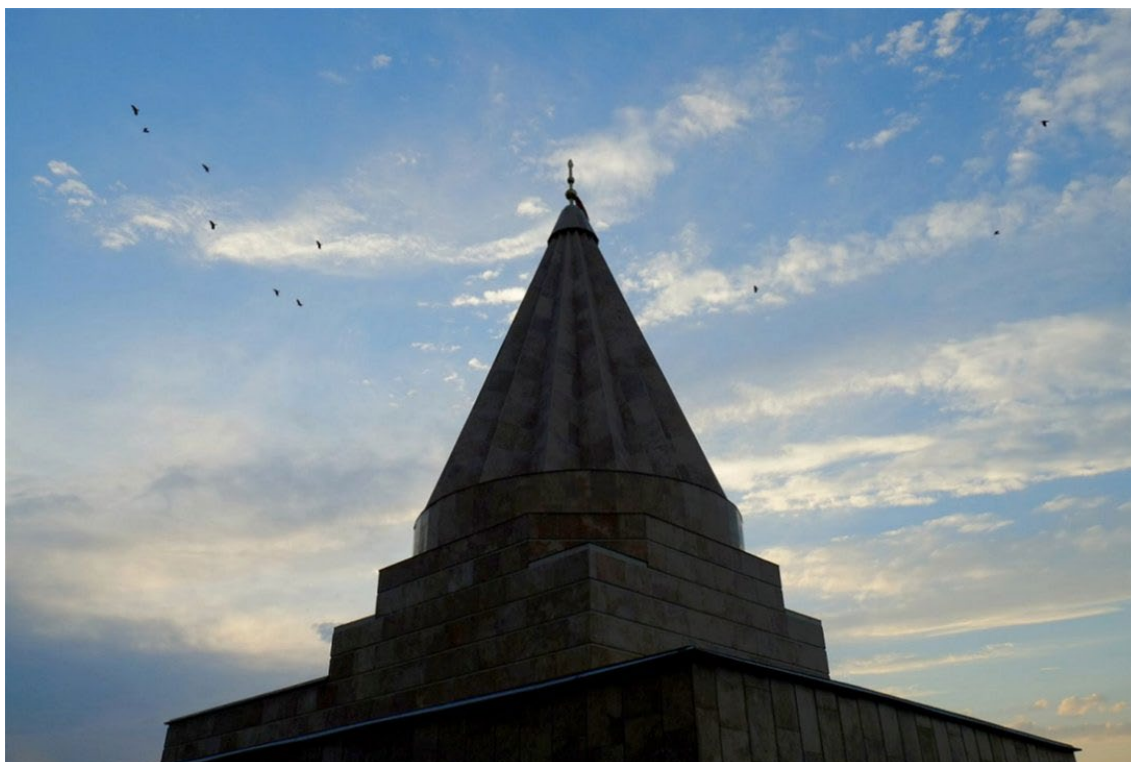
Kopuła tbiliskiej zjaraty.

To uosobienie znalazło wyraz w nas – w człowieku.