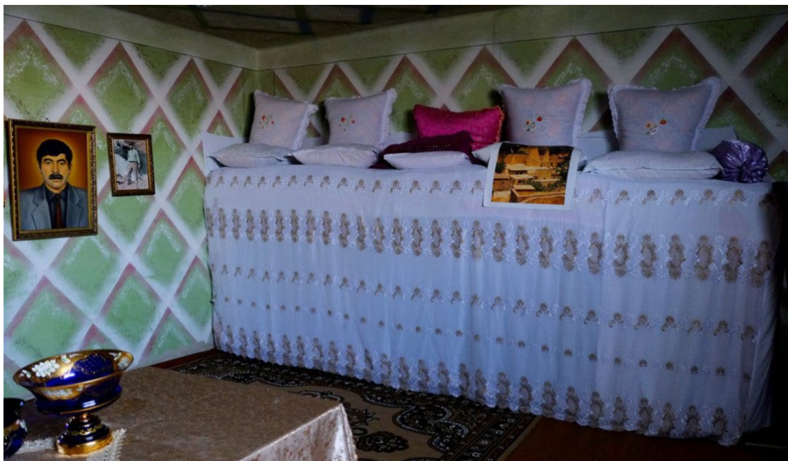
Ster w domu szejcha , Armenia.

by. Przez ostatnie dziesięciolecie staraliśmy się organizować różne święta w pomieszczeniach, które udało się nam zdobyć. To jednak ludzi nie satysfakcjonowało i z tego też powodu wielu odeszło od religii jezydzkiej. Potem kiedy już mieliśmy teren i zaczęliśmy przygotowania pod budowę, Baba Szejch i Mir złożyli tu berat i kamień, przeczytali modlitwę i poświęcili to miejsce.