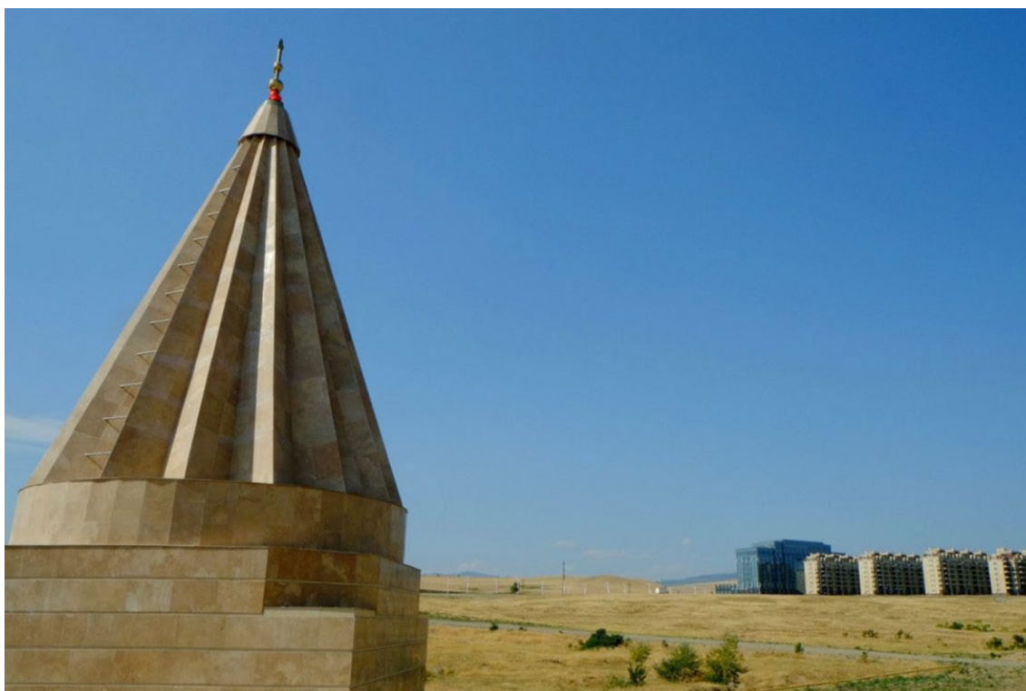
Kopuła tbiliskiego sanktuarium.

Zależało nam na tym, aby ogólna forma była podobna, aby miała jezydzki styl. Z kolei sam mieszczący się obok świątyni budynek administracyjny Centrum Kultury nawiązuje do mezopotamskiej, babilońskiej stylistyki.