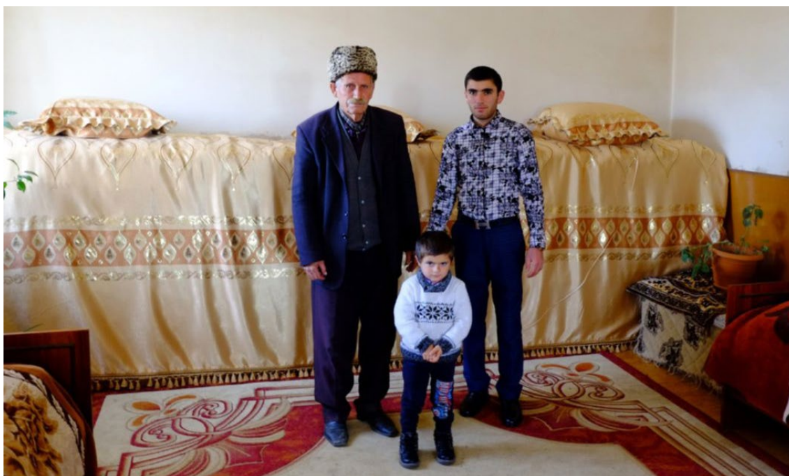
Ster w domu pira , Armenia.