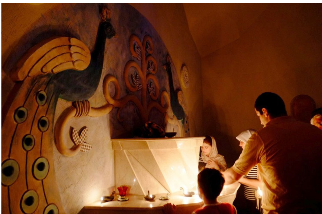
Jezydzi modlący się tbiliskim sanktuarium.