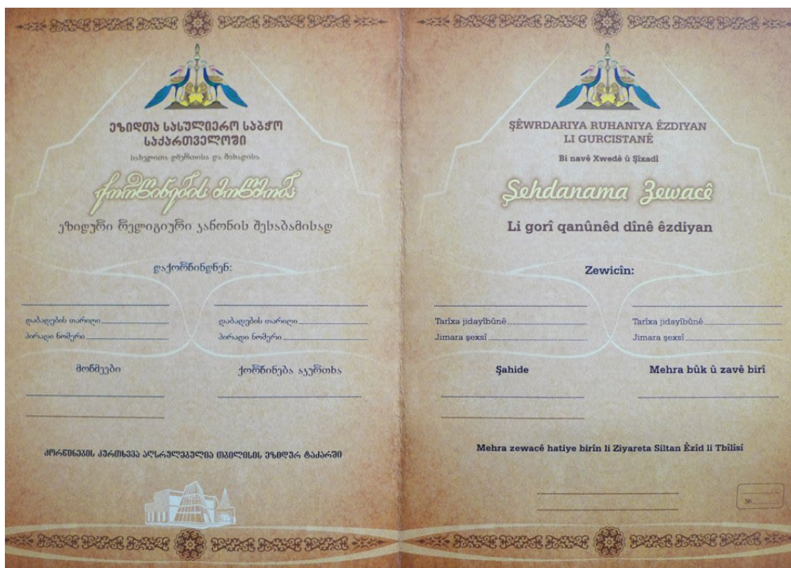
Wydawany przez DJWG formularz aktu zawarcia związku małżeńskiego.

Nie mamy takich danych. Ludzie, którzy to robią, stopniowo odchodzą. Rzadko kto zostaje, asymilują się.