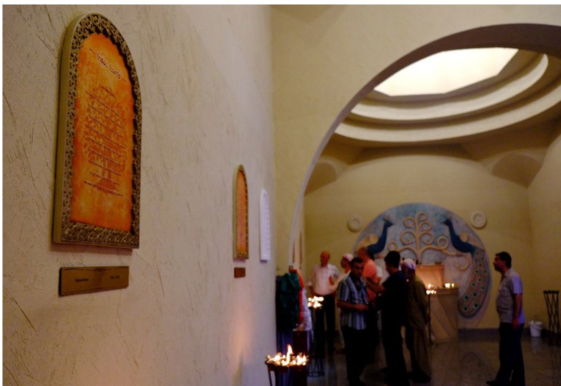
Tablice z modlitwami w zjaracie, Tbilisi.

Temu, od którego wywodzimy swój ród – Pirowi Bahri.