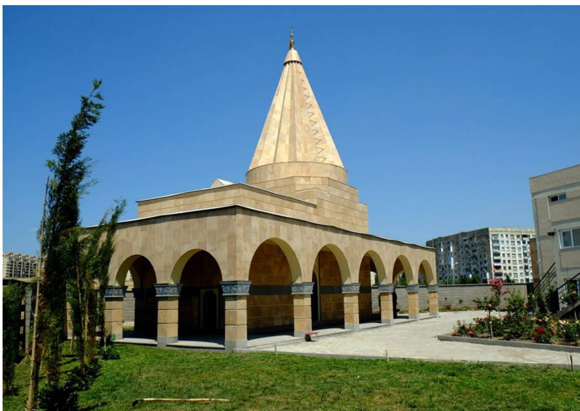
Zjarata „Quba Siltan Êzîd” w Tbilisi.

Niestety na skutek narastania konfliktu między Duchową Radą a głównym fundatorem kompleksu, który rok później upomniał się o prawo własności do obu budynków, najprawdopodobniej w drodze kompromisu dojdzie do ich podziału tak, że wyłącznie sam budynek świątyni pozostanie w gestii Duchowej Rady.