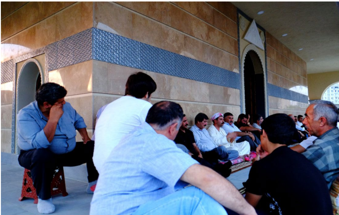
Kazanie Pira Dimy, Tbilisi.