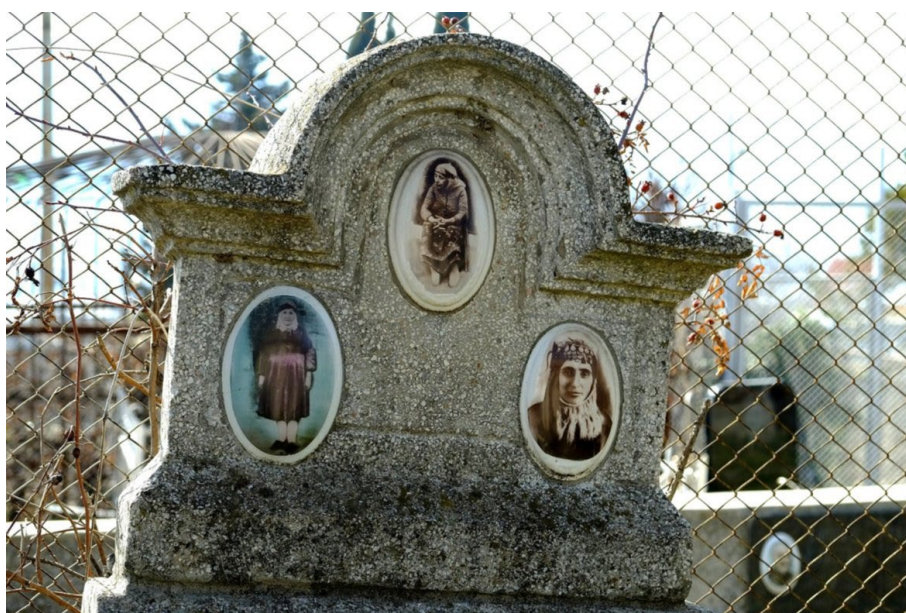
Fragment jezydzkiego grobu w Tbilisi.

To nie jest jezydzka tradycja. W jezydzkiej tradycji mówi się o tym, że człowiek złożony jest z ziemi i prochu i powinien powrócić do ziemi.