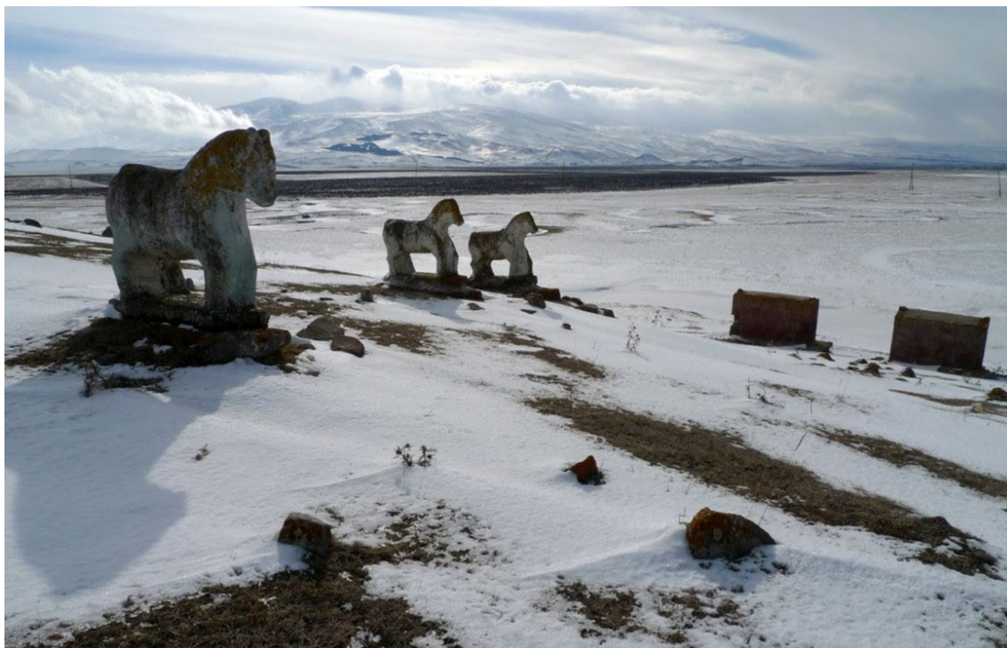
Jezydzki cmentarz w Armenii.

W każdej religii są tajemnice, których nie ujawnia się niewtajemniczonym. Jezydzka religia nie jest wyjątkiem.