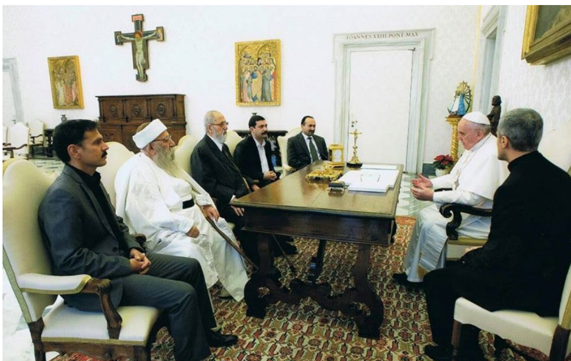
Audycja przedstawicieli Jezydów w Watykanie w 2015 roku