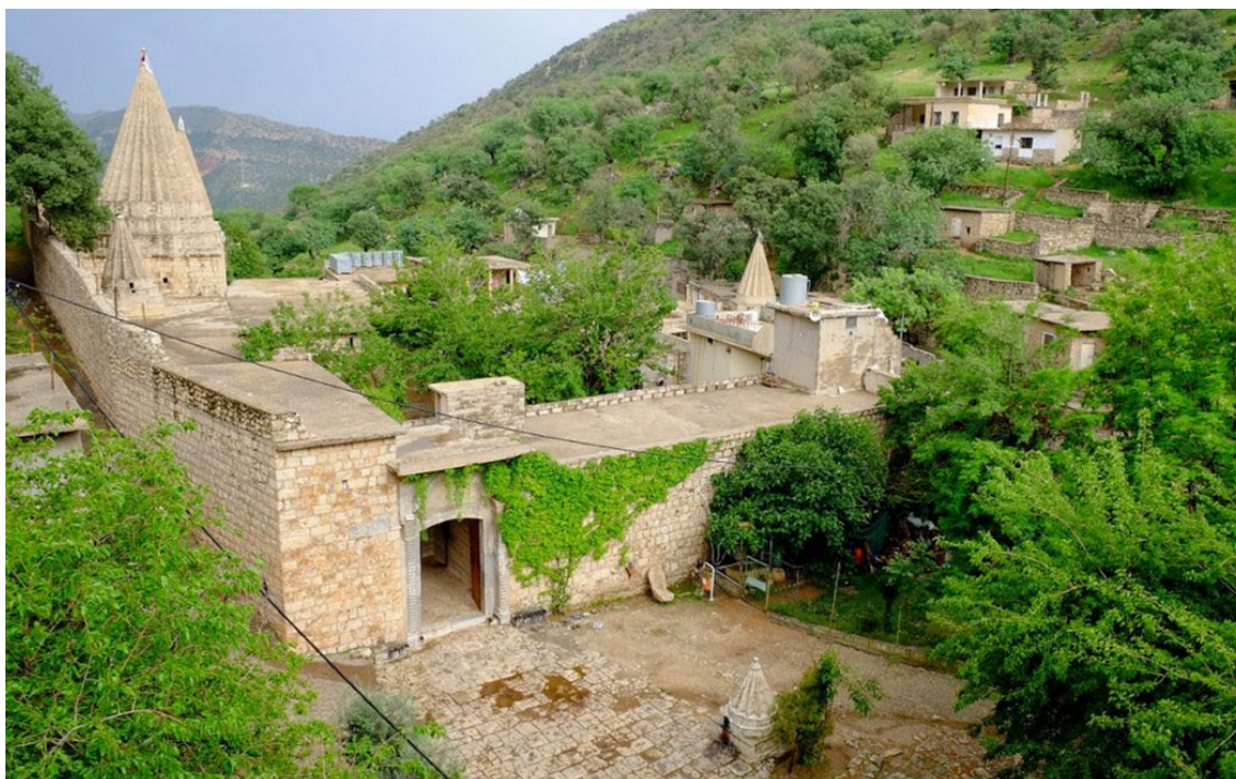
Iracka dolina Lalisz z mauzoleum Szejcha Adiego.

Gruziński Kościół Prawosławny utrudniał działalność także wyznawcom innych religii, m.in. np. w 2005 i 2006 zablokowano budowę miejsc kultu asyryjskich chrześcijan i baptystów. Podobne kłopoty mieli też katolicy, wierni Apostolskiego Kościoła Ormiańskiego, luteranie, zielonoświątkowcy, muzułmanie czy świadkowie Jehowy (zob. raporty: Corley 2003, 2006).