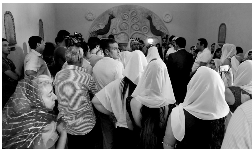
Wnętrze tbiliskiej zjaraty .

Nie. W kellach jest filozofia, teozofia itd., a to jest obszar tradycji religijnej.