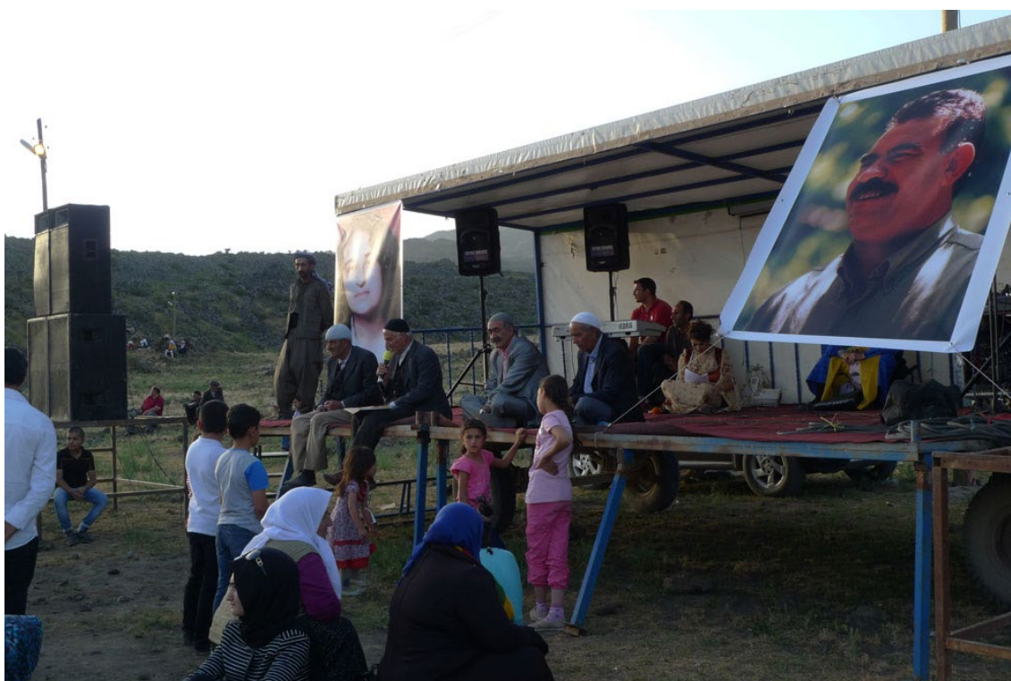
Fot.1. Zwolennicy Abdullaha Öcalana podczas jednej z partyjnych uroczystości odbywającej się w czasie świątecznego miesiąca Ramadanu. Spotkanie poprzedziła modlitwa poprowadzona przez przybyłych mułłów, okręg Ağrı, lipiec 2015

wszystkim wokół stowarzyszenia Nûbihar . Mimo że przez lata wysiłki Nûbihar były raczej lekceważone przez kurdyjską lewicę, w ostatnich latach wyraźnie widać pewne ocieplenie po obu stronach. Ma to związek ze zmianą nastawienia lewicy do islamu., które stało się zdecydowanie mniej negatywne. Jest to motywowane kilkoma czynnikami: uznaniem islamu za jeden z elementów kurdyjskiej (i ludowej) tożsamości (na co wskazywał sam Abdullah Öcalan), działalnością muzułmanów (tj. w tym wypadku ludzi otwarcie przywiązanych do tradycji religijnej) w szeregach partii HDP i partyzantki oraz celem jak najbardziej pragmatycznym – wolą odebrania głosów promuzułmańskiej tureckiej Partii Sprawiedliwości i Rozwoju (AKP), zwłaszcza w kurdyjskich regionach na wschodzie Turcji.