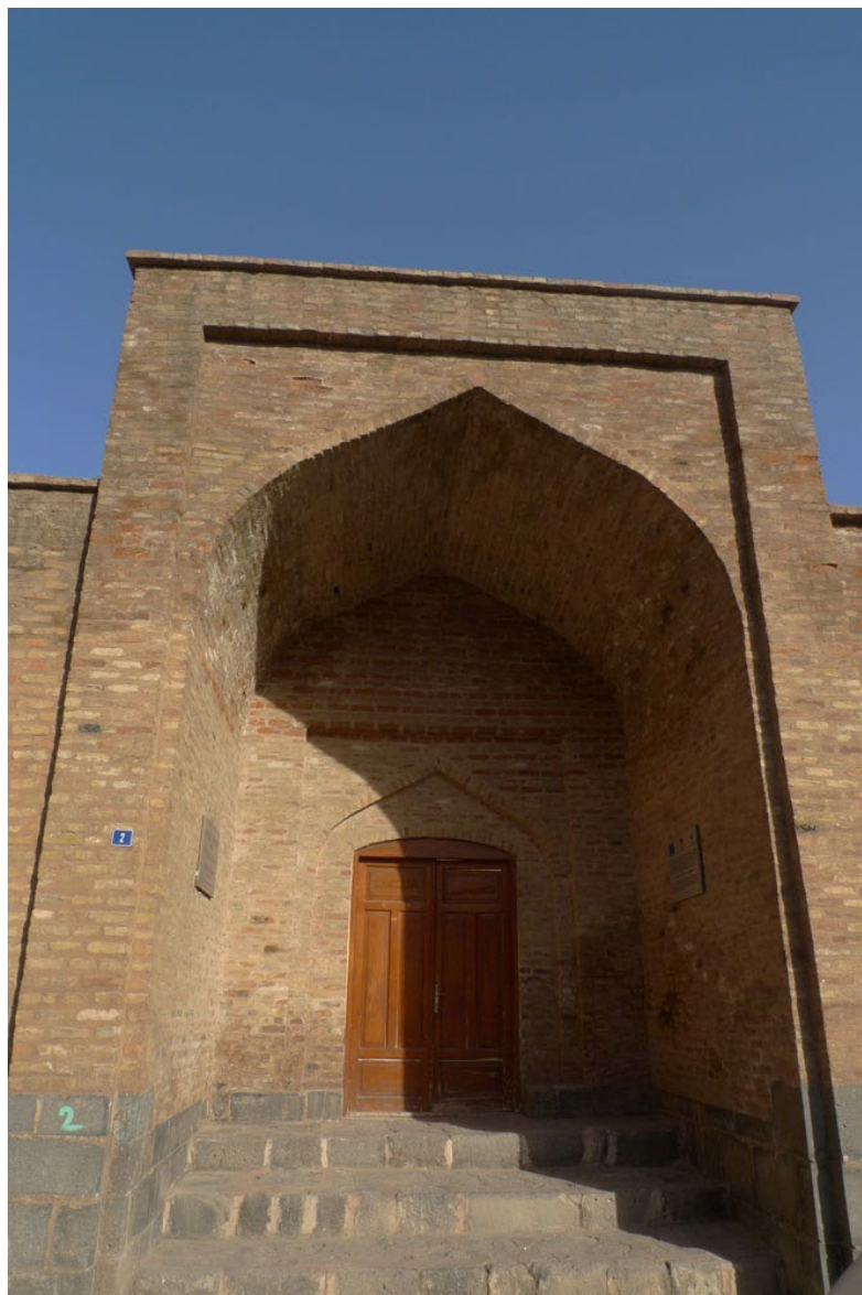
Fot. 12. Medresa Sor (Czerwona Medresa) w Cizirze, 2013

ture. W przypadku Kurdów, którzy nie mają swojego państwa, takie zadanie spada na barki instytucji kulturalnych. Warto podkreślić, że w przypadku kurdyjskich instytucji działalność kulturalna ma swoje źródło w szczerym przywiązaniu do pewnych wartości i szczerzej, dobrowolnej trosce o nie, nie zaś w kwestiach politycznych czy finansowych, jak w przypadku państwa. Dla wielu ludzi wiąże się to z różnymi wyrzeczeniami i poświęceniem. W tworzeniu tej kultury biorą też udział ludzie, którzy na co dzień wykonują inne zawody. Są doktorami, inżynierami, robotnikami, nauczycielami, ale zależy im na własnej kulturze.