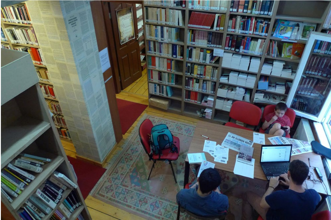
Fot. 7b. Fundacja İsmaila Beşikçi, Stambuł 2013