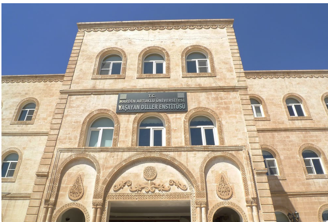
Fot. 16. Instytut Języków Żywych, Uniwersytet Artuklu, Mardin 2013, fot. JB

Tłumaczenie z języka kurdyjskiego dialektu kurmandżi: Joanna Bocheńska