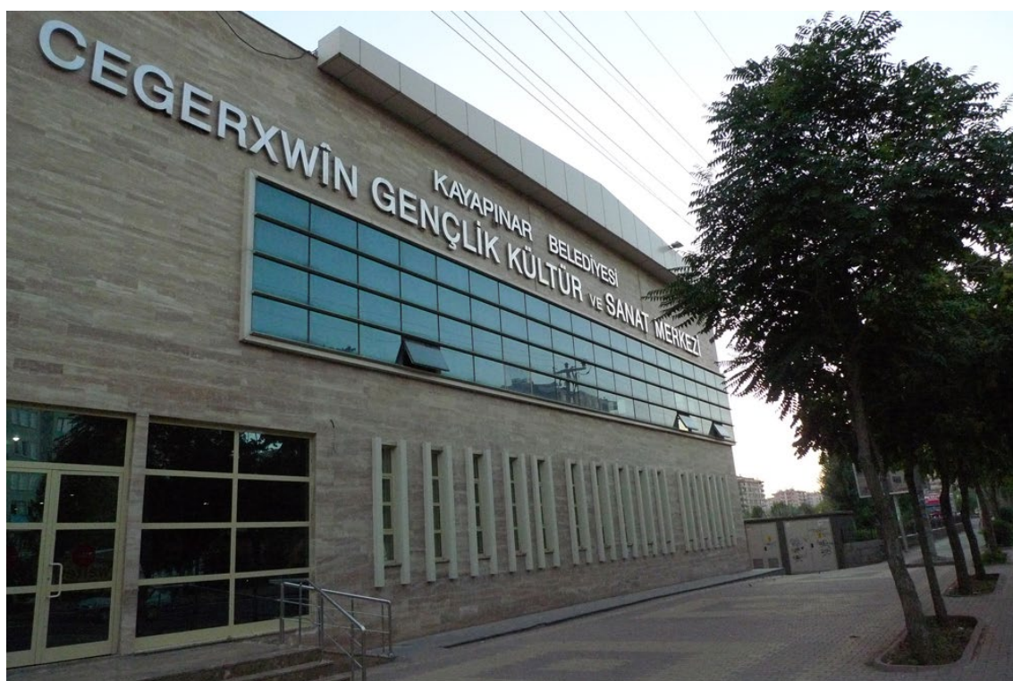
Fot. 10. Centrum Młodzieży, Kultury i Sztuki im. Cegerxwîna, Diyarbakir 2012

ludzi bez religii, Ormian, Żydów, nie wiadomo kogo. Ale tysiące muzułmańskich duchownych (mułłów) zostało członkami PKK. Również wiele dzieci mułłów i osób religijnych dołączyło do PKK. Religii nie da się oddzielić od tej ziemi. Ale Turcy dziś potrafią powiedzieć, że Kurdowie nie umieją prawidłowo wykonywać ablucji. Choć przecież przyjęliśmy islam na wiele lat wcześniej, przed Turkami. Jako muzułmanie sami dobrze znamy tę religię i nikt nas nie musi jej uczyć.