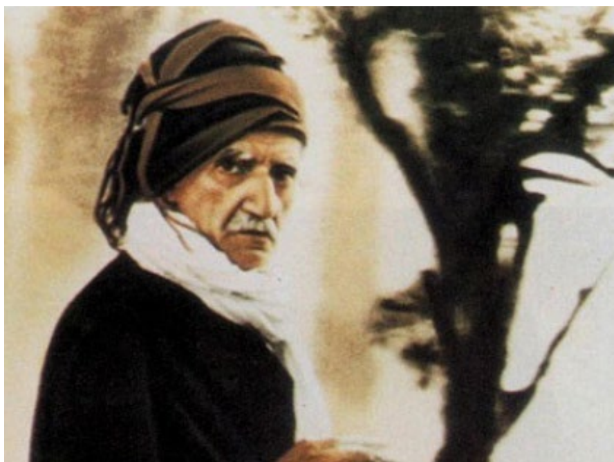
Fot. 13. Said Nursi (1877-1960)

AŞ: Said Kurdi wskazywał, że prorocy przybywali ze Wschodu, a filozofowie z Zachodu. To, co wciąż podtrzymuje istnienie ludzi na Wschodzie, to jest religia i wiara. Lewicowy Kurd może wierzyć w idee socjalistyczne, a nie w islam, ale podświadomie jest wciąż bardzo związany z islamem i jego praktyką. Ziemia Kurdów jest ziemią, na której od najdawniejszych czasów pojawiali się prorocy (np. Nuh, Ibrahim 42 ). A więc to ci ludzie, którzy „zapraszali” innych do wiary w Boga, w jedyność Boga 43 i pomagali wybawiać ludzi od przemocy i zła. Prorocy zawsze pomagali uciemiężonym. Dlatego nawet jeśli mamy do czynienia z socjalistą, internacjonalistą, marksistą, ateistą, wszystko jedno, to i tak przepelnia go wiara, która jest związana z tym społeczeństwem, z jego kulturą i historią. Dla Kurdów wiara jest czymś naturalnym, związanym z przyrodą. Dla Turków religia była traktowana w kategoriach politycznych i to widać w praktyce ich życia. Codzienna praktyka to jest to, co te dwie kultury od siebie odróżnia.