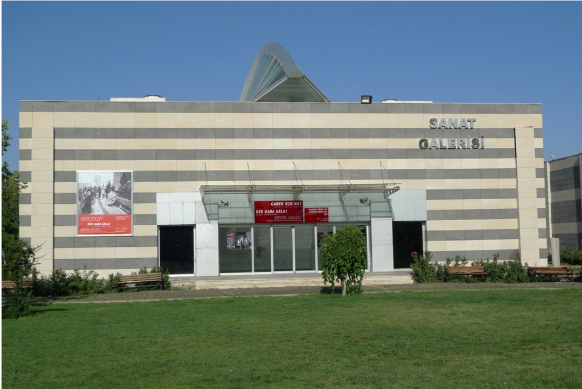
Fot. 9. Galeria Sumer Park, Diyarbakir 2014

i zdaliśmy sobie sprawę, że wielu ludzi dowiadywało się o tym wydarzeniu po raz pierwszy właśnie dzięki tym wystawom. Na wystawie o Halabdz 25 wielu płakało. To pokazuje, że sztuka pozwala przybliżać ludzi i narody do siebie. Kilka lat temu wystawę odwiedzało 100 osób, dziś jest to około 1000. Oddziaływanie kultury i sztuki jest oddziaływaniem powolnym i stopniowym. Może dopiero za 5 lat będziemy mogli mówić o znacznym oddziaływaniu sztuki i kultury na ludzi. Potrzeba również, aby kultura, sztuka i instytucje, które je reprezentują, mogły rozwijać się jako organizacje niezależne, poza instytucjonalizacją państwową. Poważnym problemem jest jednak stworzenie takich instytucji, bo wymaga to dużych nakładów finansowych i nie jest to zadanie dla jednej osoby; ani w Kurdystanie, ani nigdzie indziej. Nasza galeria jest otwarta na różnych ludzi, ale jeśli Kurd spróbuje w Stambule zrobić wystawę jako Kurd, będzie to trudne. Dlatego ważne jest, żeby działalność kulturalna uniezależniła się od państwa. Działamy jako insty-