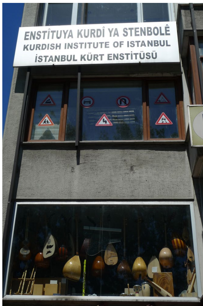
Fot. 6. Instytut Kurdyjski w Stambule

słowniki kurdyjsko-tureckie oraz wznowienia klasycznych autorów kurdyjskich takich jak na przykład Feqiyê Teyran.