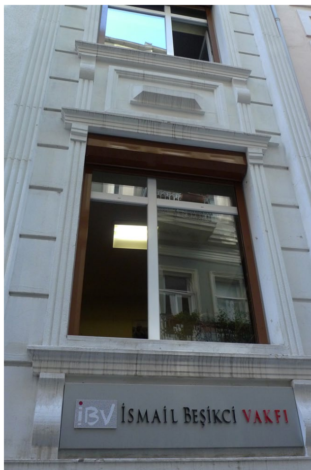
Fot. 7a. Fundacja İsmaila Beşikçi, Stambuł 2013

mi lewicowymi lat sześćdziesiątych i siedemdziesiątych XX wieku takimi jak Rizgarî i Kawa . Zyskała ona oficjalny status w 2011 roku. W ramach jej działalności otwarto w Stambule siedzibę główną, w której znajduje się między innymi otwarta biblioteka naukowa oraz studio radia Yaşam (tur. życie). Ma ona na celu opiekę nad dziełami swojego patrona, ich popularyzację, a także prowadzenie działalności wydawniczej, wspieranie projektów naukowych dotyczących Kurdów oraz organizację konferencji, seminariów, kursów oraz stypendiów wspierających badania kurdologiczne. Wśród bogatej działalności wydawniczej w roku 2015 nakładem fundacji ukazała się książka analizująca ruchy kurdyjskie działające przed powstaniem PKK autorstwa Celala Temela (tytuł oryginalny: Kürtlerin Silahsız Mücadelesi : 1984'den Önceki 25 Yılda , co oznacza „Walka Kurdów bez użycia broni: w ciągu 25 lat przed rokiem 1984”). Fundacja ma także swoje oddziały, między innymi w Amed (Diyarbakır) i Erbilu (kurdyjska nazwa Hawlêr) –stolicy Regionu Kurdystanu w Iraku.