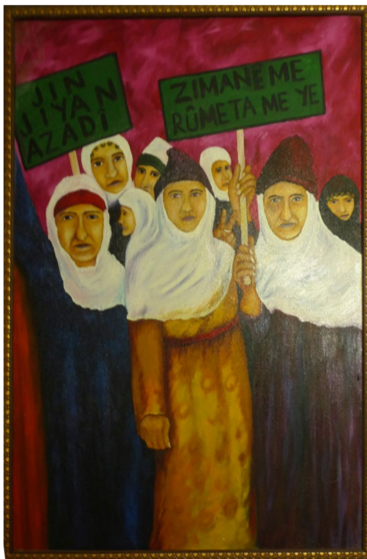
Fot. 4. Obraz wiszący w biurze organizacji Kurdî Der w Diyarbakir z wymalowanymi na nim hasłami „Kobieta, Życie, Wolność” i „Nasz język jest naszą godnością”.

Polityka zbliżenia kurdyjskiej lewicy i muzułmanów, choć nie jest na Bliskim Wschodzie czymś zupełnie nowym, zasługuje na uwagę zarówno ze względu na kształt realizowanej polityki kulturalnej, jaki i polityki większego, ogólnokrajowego formatu. Wyniki wyborów parlamentarnych, zarówno lipcowych, jak i listopadowych roku 2015, pokazały, że większa elastyczność ideowa z lewej i prawej strony kurdyjskiej sceny politycznej sprzyja pozytywnym результатам. Ponadto patrząc na kurdyjskie osiągnięcia w sferze literatury i sztuk pięknych, widać wyraźnie, że najciekawsze owoce przynosi inspiracja czerpana z wielu źródeł: zarówno tradycyjnych jak i nowoczesnych.